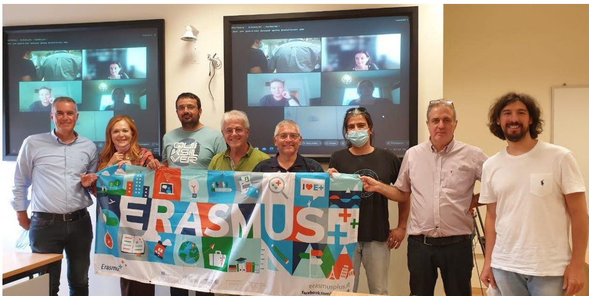
Parceiros do projeto SSE no encontro de trabalho em Atenas.