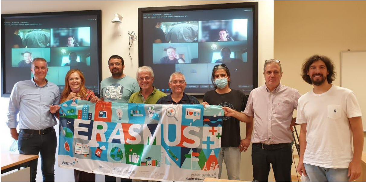
Οι εταίροι του έργου SSE κατά τη διάρκεια της συνάντησης στην Αθήνα.